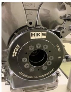
VR43専用クランクダンパー (ATI社と共同開発)